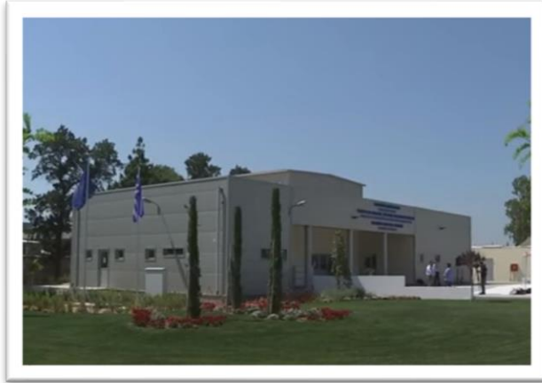
Εικόνα 3 Το τζαμί της Αθήνας στον Βοτανικό.

Προσπάθειες για την ανέγερση Ισλαμικού Τεμένους έγιναν το 1934, το 1956, επί χούντας και το 2000 χωρίς αποτέλεσμα 7 . Το ζήτημα έγινε επίκαιρο με τους Ολυμπιακούς Αγώνες και την άφιξη μεταναστών από μουσουλμανικές χώρες. Το κατασκευή του ξεκίνησε το