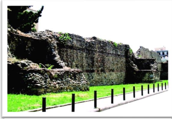
Εικόνα 1 Το βυζαντινό φρούριο της Κομοτηνής στοιχείο ιστορικού τεκμηρίου.

έναν ανδριάντα, ένα κτίριο, ένα οχυρό ή μια πόλη 3 . Κατά τον Norbert Elias (1897-1990) αυτά τα υλικά τεκμήρια δείχνουν ότι οι κοινωνίες στηρίζονται σε σύμβολα για να οριοθετήσουν μεταξύ άλλων και την συλλογική ταυτότητά τους, ο δε Roland Gérard Barthes (1915-1980) τα ονόμασε «αστικά κείμενα» 4 .