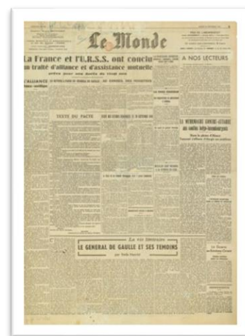
Εικόνα 1 Το πρώτο φύλο της εφημερίδας Le Monde που κυκλοφόρησε στις 19 Δεκεμβρίου 1944.

Ο ελληνικός εμφύλιος ήταν ένα από τα πρώτα γεγονότα του Ψυχρού Πολέμου και απασχόλησε τον Τύπο και την Κοινή Γνώμη της Δύσης. Σε αυτόν αναφέρθηκαν όλες οι εφημερίδες και οι πολιτικές δυνάμεις παίρνοντας θέση. Οι απόψεις διαμορφώνονταν σύμφωνα με τη πολιτική τοποθέτηση, τις εμπειρίες και την εικόνα που είχαν για την Ελλάδα και τους Έλληνες 1 . Στο κείμενο θα ασχοληθούμε με το αν αυτή η εικόνα είναι ακόμη ενεργή και επηρεάζει τις σύγχρονες αναλύσεις. Αρχικά θα παρουσιάσουμε την «εικόνα» που είχε ο γαλλικός Τύπος και τα Μέσα Μαζικής Ενημέρωσης (ΜΜΕ) κατά τον Εμφύλιο και στην συνέχεια θα εξετάσουμε αν αυτή η «εικόνα» ισχύει στη παρουσίαση της ελληνικής οικονομικής κρίσης του 2009-2013.