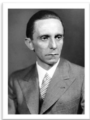
Εικόνα 2 Joseph Goebbels

φορά εκπομπή παρασίτων για πολιτικούς λόγους και ραδιοφωνική διαμάχη 5 . Στις κατακτημένες χώρες η Γερμανία χρησιμοποιεί τις τοπικές εγκαταστάσεις στην μετάδοση πολιτικών μηνυμάτων, μέσω προγραμμάτων ποικίλου περιεχομένου 6 , όπως αυτή του «Λόρδου Haw-Haw» 7 . Η ραδιοφωνική προπαγάνδα στρέφεται και προς το εσωτερικό της Γερμανίας. Προσφέροντας φτηνά ραδιόφωνα, που λάμβαναν μόνο γερμανικούς σταθμούς, εξαφανίζουν κάθε διάθεση για αντίσταση 8 . Ανάλογη είναι και η συμπεριφορά της Ιταλίας 9 .