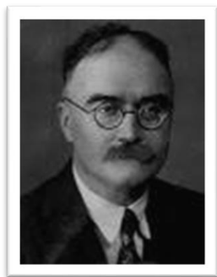
Εικόνα 1 Maurice Halbwachs

Ως ατομική μνήμη ορίζουμε τα γεγονότα της ζωής ενός ανθρώπου όπως παρουσιάζονται νοητικά από τον ίδιο. Είναι η αυτοβιογραφική περιγραφή ενός γεγονότος, με την οποία προσπαθούμε να εξηγήσουμε σε τρίτο άτομο, την σχέση μας με αυτό και τα διεγερόμενα συναισθήματα, χρησιμοποιώντας τις αναμνήσεις μας. 3 Είναι «μια κοινωνικά διαμοιρασμένη εμπειρία» 4 που καθορίζει την ταυτότητά μας 5 και μας προκαλεί έντονα συναισθήματα. 6 Λόγω αυτών των στοιχείων, στο παρελθόν, ασκήθηκε κριτική στην χρήση της ατομικής μνήμης στην έρευνα, που όμως αποδείχθηκε λανθασμένη. 7