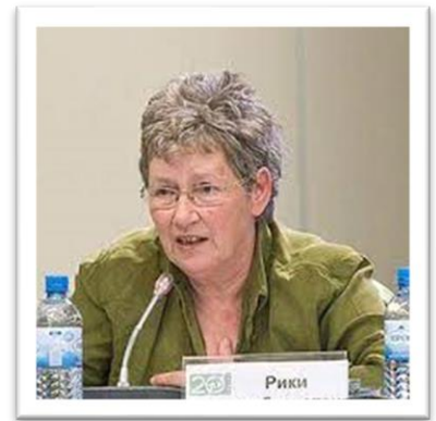
Εικόνα 5 Ρίκη Βαν Μπούσχοτεν

Οι εργασίες της Μπούσχοτεν είναι για μερικούς ιστορικούς άριστο παράδειγμα χρήσης της προφορικής ιστορίας ως εργαλείο έρευνας, αν και την μεθοδολογία της δεν την ακολούθησαν είτε γιατί την θεώρησαν «εύκολη» και χωρίς μεθοδολογικά χαρακτηριστικά, είτε γιατί αντιμετώπιστηκε με καχυποψία από τους ιστορικούς της παραδοσιακής ή της αναθεωρητικής τάσης. Η προφορική ιστορία όμως θεωρείται και είναι ένα από τα καταλληλότερα εργαλεία για την έρευνα και μελέτη των εμφύλιων περιόδων, λόγω του γεγονότος ότι οι μνήμες και τα βιώματα είναι έντονα και έχουν σημαντικό ρόλο στην διαμόρφωση της εικόνας. 44