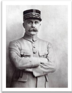
Εικόνα 7 Henri Phillippe Pétain Ο Πρωθυπουργός της Γαλλίας του Βισύ.

Παράδειγμα συζητήσεων από την πλευρά των ηττημένων μπορούμε να αναφέρουμε αυτό της Γερμανίας. Η ιστοριογραφία προσπάθησε να απαντήσει στο ερώτημα πως ο Χίτλερ κατάφερε να κατακτήσει την εξουσία, δημιουργώντας μια «διαμάχη ιστο-