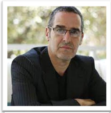
Εικόνα 6 Mark Mazower

Στην συζήτηση αυτή ο ιστορικός καλείται να διαχωρίσει τους όρους «συνεργασία» και «δωσιλογισμός», τόσο σε πολιτικό όσο και σε κοινωνικό επίπεδο και να εντοπίσει τους λόγους που εκφράστηκε ο ένας ή ο άλλος σε κάθε χώρα και στην Ελλάδα. 48 Δεν πρέπει να υποτιμηθούν επίσης δύο άλλοι παράγοντες που συνέβαλαν στην εμφάνιση του δωσιλογισμού, καθιστώντας την ιδεολογία βασικό στοιχείο. Ο αντικομμουνισμός και ο εθνικισμός. 49 Αυτοί για τους επικριτές του Καλύβα, δεν μπορούν να αγνοηθούν. Για τον Mark Mazower (1958 - ) οι Έλληνες δωσίλογοι συνεργάστηκαν με τους κατακτητές για τρεις λόγους: