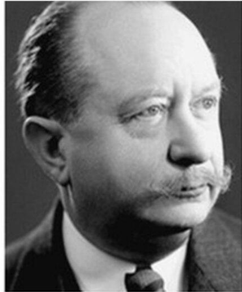
Οι ιδρυτές Marc Bloch και Lucien Febvre

νωνικής ζωής και όχι όπως θεωρούσε ο Θετικισμός για τα επίσημα ιστορικά γεγονότα. Αυτό δηλώνει και ο υπότιτλος του περιοδικού. 4