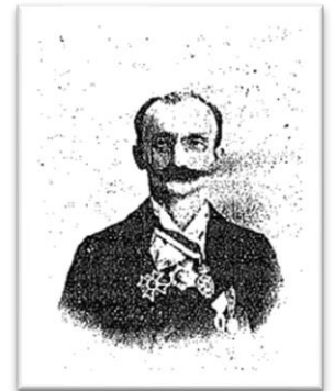
Εικόνα 2 Μανουήλ Γεδεών

Σε αυτό το πλαίσιο οι Σπυρίδων Ζαμπέλιος (1815-1881) και Κωνσταντίνος Παπαρρηγόπουλος (1815-1891), απέριψαν την ιστοριογραφία του γένους, η οποία είχε κύριο εκπρόσωπο τον Μανουήλ Γεδεών (1851-1943), προτείνοντας την εθνική ιστορία. 4 Η ιδέα του έθνους είχε εκφραστεί ήδη σε κείμενα των στοχαστών του ελληνικού διαφωτισμού, εισάγοντας την ιδέα της συνέχειας από την ελληνική αρχαιότητα, με διακριτά στοιχεία καθορισμού την γλώσσα, τον πολιτισμό και τις ηθικές αξίες. 5 Έχοντας δηλώσει τα στοιχεία ταυτότητας έπρεπε να