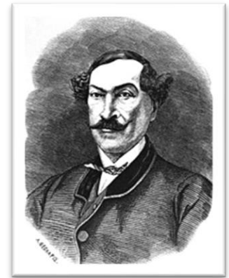
Εικόνα 1 Σπυρίδων Ζαμπέλιος

Η ανακήρυξη του ελληνικού κράτους δημιούργησε την ανάγκη απόκτησης του ιδρυτικού ιστορικού μύθου του. Τότε γεννήθηκε η ελληνική εθνική ιστοριογραφία. Με παρακαταθήκη τα κείμενα των φιλελλήνων ιστορικών για το 1821, οι Έλληνες εθνικοί ιστοριογράφοι προσέγγισαν την ελληνική ιστορία ως ενιαία, αρχίζοντας από τα αρχαία χρόνια και φτάνοντας μέχρι την δημιουργία του κράτους, προσπαθώντας να τεκμηριώσουν την επιβίωση των Ελλήνων ως έθνος μετά από πολλές κατακτήσεις και συμφορές. 3