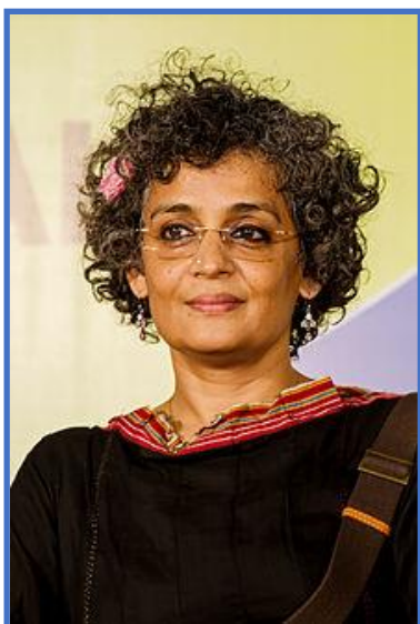
Εικόνα 1 Suzanna Arundhati Roy

Α πό την απαρχή του νέου αιώνα και από τα γεγονότα που έλαβαν χώρα στο τέλος του προηγούμενου, γίνεται φανερό ότι ένα βασικό θέμα που θα απασχολήσει τον σύγχρονο άνθρωπο θα είναι αυτό των Ανθρωπίνων Δικαιωμάτων και της Ελευθερίας γενικότερα. Έχουν περάσει εξήντα σχεδόν χρόνια από τότε, τον Δεκέμβριο του 1948,