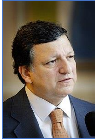
Εικόνα 2 Jose Manuel Barroso