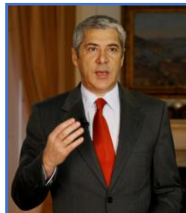
Εικόνα 3 Jose Socrates