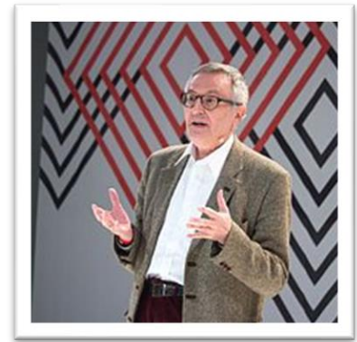
Εικόνα 5 J. N. Gray

Η πολιτική του 21 ου αιώνα όμως χαρακτηρίζεται από αυξανόμενη ιδεολογική διαφορετικότητα. Αυτό σε συνδυασμό με την κρίση που περνά ο φιλελευθερισμός και οι αρχές του Διαφωτισμού, κάνουν ορισμένους στοχαστές να αμφισβητήσουν την ιδέα της αντικειμενικής αλήθειας που αναζητά ο φιλελευθερισμός. Ένας από αυτούς, ο John Nicholas Gray (1948 -), υποστηρίζει ότι ο διάδοχος του φιλελευθερισμού θα είναι ο πλουραλισμός διότι δέχεται τόσο τις φιλελεύθερες όσο και τις μη φιλελεύθερες αξίες 10 .