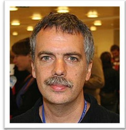
Εικόνα 4 William Kymlicka

Όλες όμως οι εθνοπολιτισμικές ομάδες στο εσωτερικό κάθε έθνους-κράτους δεν είναι ίδιες. Έχουν διαφορετικά χαρακτηριστικά και κυρίως διαφορετικές επιδιώξεις στη σχέση τους με το κράτος και την πλειονότητα. Ο William Kymlicka (1962 - ) εντοπίζει πέντε τέτοιες διαφορετικές πολιτισμικές ομάδες: τις εθνικές μειονότητες, τους μετανάστες, τις απομονωτιστικές εθνο-θρησκευτικές ομάδες, τους μέτοικους 7 και τις φυλετικές ομάδες κάστας 8 . Από αυτές οι τρεις πρώτες υπέστησαν προγράμματα εθνικής οικοδόμησης από διάφορα κράτη για να ενταχθούν, ενώ οι άλλες δύο όχι. Ένα πρόγραμμα εθνικής οικοδόμησης είναι αποδεκτό σε μια