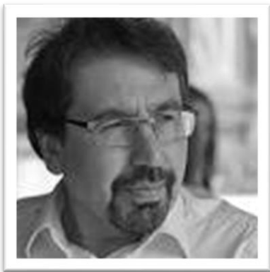
Εικόνα 6. David Held

Ο Kymlicka αντίθετα πιστεύει ότι η πολυπολιτισμικότητα μπορεί να αποτελέσει απάντηση τόσο στα προβλήματα που δημιουργεί το φαινόμενο της μετανάστευσης όσο και στον εθνικισμό, παρά τις αμφισημίες που παρουσιάζει. Και αυτό γιατί η πολύπολιτισμικότητα μπορεί να λάβει τόσο φιλελεύθερη όσο και συντηρητική μορφή στο θέμα της εθνικής οικοδόμησης. 11 Δέχεται ότι το φιλελεύθερο κράτος αν ακολουθήσει μια πολιτική «καλοπροαίρετης αμέλειας» μπορεί να αντιμετωπίσει την πολιτισμική διαφορετικότητα όπως αντιμετωπίζει το θέμα της θρησκείας.