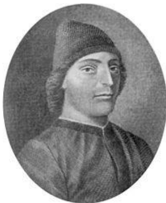
Εικόνα 3 Γκουαρίνο ντα Βερόνα

Για τους ουμανιστές η εκπαίδευση πρέπει να παρέχεται από την πολιτεία και όχι από την Εκκλησία ή το κράτος και η πρόσβαση σε αυτή να είναι απρόσκοπτη σε όλους, (Συριάτου, 2001) όντας το ίδιο σημαντική όπως η άμυνα. Δεν αποκλείονταν από αυτή οι γυναίκες. Το εκπαιδευτικό πρόγραμμά των γυναικών δεν διέφερε από αυτό των ανδρών στα περισσότερα μαθήματα. Όμως η πρόοδος τους δεν είχε τον ίδιο ρυθμό. (Power, 2001). Στόχος του εκπαιδευτικού προγράμματος των γυναικών η δημιουργία ηθικού χαρακτήρα και αυτό περιλάμβανε την μελέτη κλασσικών και χριστιανών συγγραφέων, αλλά όχι την ρητορική, διότι θεωρούσαν ότι έπρεπε να είναι ενήμερες αλλά όχι δραστήριες στα δημόσια ζητήματα. (Συριάτου, 2001).