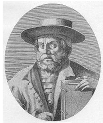
Εικόνα 2 Εμμ. Χρυσολοράς

Πίστευαν ότι η ηθική διαπαιδαγώγηση ήταν θέμα συνήθειας και σκοπός της η αρετή. Δεν θεωρούσαν ότι η γνώση από μόνη της συνιστά αρετή. Έδιναν έμφαση στην δράση και όχι στην απομνημόνευση διδαγμάτων, παρακινώντας για θάρρος, ταπεινοφροσύνη και αυτοέλεγχο. (Συριάτου, 2001). Δεν μπορούμε να πούμε ότι η φυσική άσκηση ήταν ενταγμένη στο εκπαιδευτικό πρόγραμμά τους αν και την θεωρούσαν ουσιαστικό του στοιχείο. Οι ειδικότητες που είχαν αναπτυχθεί από τον σχολαστικισμό δεν αναπτύχθηκαν, ενώ η μελέτη του Πλάτωνα είχε ιδιαίτερη αξία. (Power, 2001).