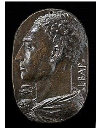
Εικόνα 5 Λ. Μ. Αλμπέρτι

Η ανθρωπιστική επιστήμη, ως αναβίωση των ελευθέρων τεχνών, δίνει δυνατότητες πνευματικής ελευθερίας και κοινωνικής δράσης μέσω διανοητικών ασκήσεων. Αν και ο Ουμανισμός χαρακτηρίζεται αρχικά για την φιλολογική αναζήτησή του, στην συνέχεια, μέσω της ρητορικής, χρησιμοποιεί την διαλεκτική με σκοπό να πεισθούν οι συν-πολίτες για την επίτευξη ενός κοινωνικού σκοπού (πολιτικός ουμανισμός). (Βαλλιάνος, 2001).