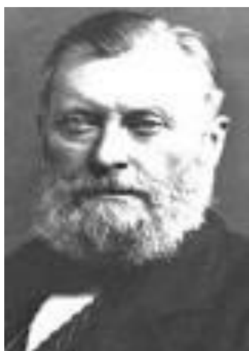
Εικόνα 2 W. E. Forster (1818 - 1886)

Ο Νόμος Forster έθεσε την εκπαίδευση υπό κρατική μέριμνα το 1870. Προέβλεπε την ίδρυση σχολικών περιοχών και αιρετών αρχών διοίκησης που συνέλεγαν φόρους για την