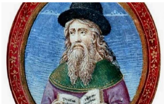
Εικόνα 3 Γεώργιος Γεμιστός - Πλήθων

Η αναβίωση του όρου «Έλλην» είναι το κλειδί της κατανόησης της βυζαντινής αναγέννησης ως ελληνικής αναγέννησης. Οι Βυζαντινοί θεωρούν την ελληνική παιδεία μεγάλο κεφάλαιο σε έναν κόσμο που για μεν την αυτοκρατορία καταρρέει πολιτικά,