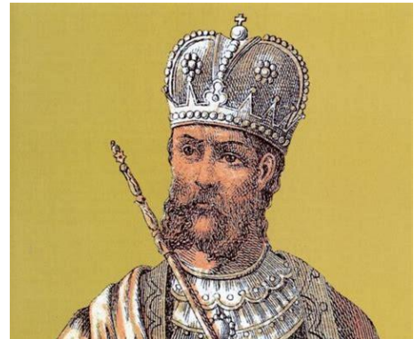
Εικόνα 2 Αυτοκράτορας Μανουήλ Β' Παλαιολόγος

Η Βυζαντινή Αυτοκρατορία τον 14 ο αιώνα εξέρχεται από μια σειρά εμφύλιων διαμαχών και πολέμων με αποτέλεσμα την πολιτική ενίσχυση της αριστοκρατίας και ταυτόχρονα την οικονομική καταστροφή της. Το αστικό στοιχείο που αποτελείται από εμπόρους, ναυτικούς και τραπεζίτες αναπτύσσεται. Πηγή πλούτου το εμπόριο που ασχολείται με την εκμετάλλευση της υπαίθρου αλλά και με την ανάπτυξη νέων εμπορικών δρόμων. 12 Η επικράτεια συρρικνώνεται σε μερικές πόλεις – κράτη με έντονη πνευματική ανάπτυξη. 13 Οι πρίγκηπες ενδιαφέρονται για την υποστήριξη των λογίων, με πρώτο τον Αυτοκράτορα Μανουήλ Β' Παλαιολόγο, συνεχιστή μιας σειράς λογίων Αυτοκρατόρων. 14