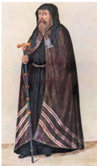
Εικόνα 4 Γεννάδιος Σχολάριος

(1324 – 1398) και ο Φραγκίσκος Φίλελφος (1398-1481) μαθαίνουν λατινικά για να γνωρίσουν την σκέψη των δυτικών λογίων. 20