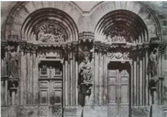
Εικόνα 1 ΤΟ ΠΡΟΣΤΥΧΟ ΤΟΥ ΝΟΤΙΟΥ ΚΑΙΤΟΥΣ ΣΤΟΝ ΚΑΘΕΔΡΙΚΟ ΝΑΟΥ ΤΟΥ ΣΤΡΑΣΒΟΥΡΓΟΥ (1230)

Τον Μεσαίωνα δεν υπήρχε η απαίτηση από τον καλλιτέχνη να είναι πρωτότυπος. Τα έργα παλαιότερων δημιουργών είχαν θεωρηθεί ως πρότυπα και ο ρόλος του καλλιτέχνη ήταν απλά να αναπαριστά τα πρότυπα αυτά. Επίσης ζητούμενο δεν ήταν να αναπαρασταθεί πιστά αυτό που έβλεπε στην Φύση ή να δημιουργήσει ωραία έργα. Αυτό που επεδίωκε ήταν να μεταφέρει με λιτό και κατανοητό τρόπο την θρησκευτική πίστη. Δεν είχε κοινωνική αναγνώριση και θεωρούνταν απλός τεχνίτης. 5