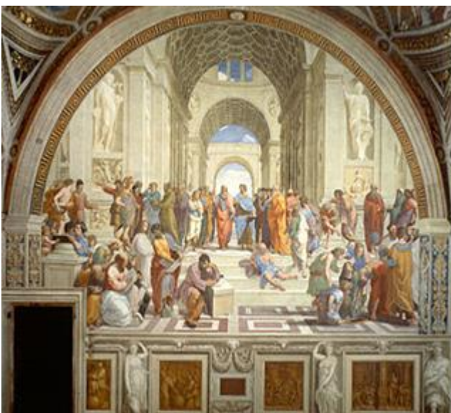
Εικόνα 3 Ραφαήλ 1510 – 1511 ΣΧΟΛΗ ΤΩΝ ΑΘΗΝΩΝ

Ο Ραφαήλ Σάντι γεννήθηκε στο Ούρμπινο και μαθήτευσε στην Περούτζια κοντά στον ζωγράφο Πιέτρο Περουτζίνο (1446-1523). Γνώρισε το έργο του Μιχαηλάγγελου όταν πήγε για λίγο στην Φλωρεντία. Μελέτησε σε βάθος τις τεχνικές των μεγάλων δημιουργών της εποχής του και με τον τρόπο αυτό δημιουργεί την δική του τεχνοτροπία. Το 1508 τον καλεί ο ουμανιστής πάπας Ιούλιος Β' (1443-1513) και του αναθέτει την διακόσμηση της αίθουσας της υπογραφής 22 . Η τοιχογραφία καλύπτει τρεις ημικυκλικούς τοίχους ανάμεσα στους