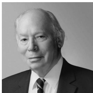
Εικόνα 3 Steven Weinberg

Λίγο παρακάτω στο ίδιο έργο δίνει έναν ορισμό της έννοιας τον οποίο θα αποδεχθούμε για την συνέχεια της σκέψης μας. Θεός νοείται ένας υπερφυσικός δημιουργός που «αξίζει να τον λατρεύουμε». 6