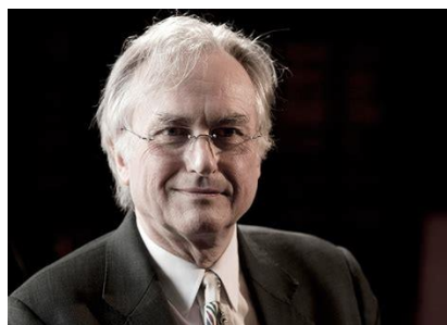
Εικόνα 4 Richard Dawkins

Αντίθετα για τον οπαδό του Ευφυούς Σχεδιασμού η Δημιουργία έχει σκοπό και πρέπει να τον αναζητήσουμε. Για τους περισσότερους ο σκοπός αποκαλύπτεται στην μετά θάνατο ζωή και εκεί βρίσκεται η αξία της ίδιας της ύπαρξης, διότι εκεί βρίσκεται ο σχεδιαστικός Νους. Η καθημερινότητά του είναι προκαθορισμένη από τις επιταγές συμμόρφωσης του 'Ευφυούς Νου' ο οποίος μέσω των ηθικών – θρησκευτικών προτροπών του, καθοδηγεί στην εκπλήρωση του Σχεδίου. Η παθητική αποδοχή των επιταγών αυτών δίνει νόημα