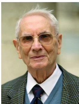
Εικόνα 1 Pierre Hadot

Σωκράτης και μετά από μια ανταλλαγή λόγων, του λέγει ότι για να ανταποκριθεί στις απαιτήσεις της επιθυμίας του πρέπει να μάθει να επιμελείται του Εαυτού του. 1