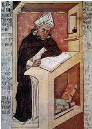
Αλβέρτος ο Μέγας

Σ την λογοτεχνία της Δυτικής Ευρώπης συναντάμε στις αρχές της 2 ης χιλιετηρίδας την χριστιανική κοινωνία της εποχής συγκροτημένη σε ένα σχήμα τριών κοινωνικών τάξεων - Ιερείς, πολεμιστές και αγρότες - οι οποίες ήταν ξεχωριστές και συμπληρωματικές. Η